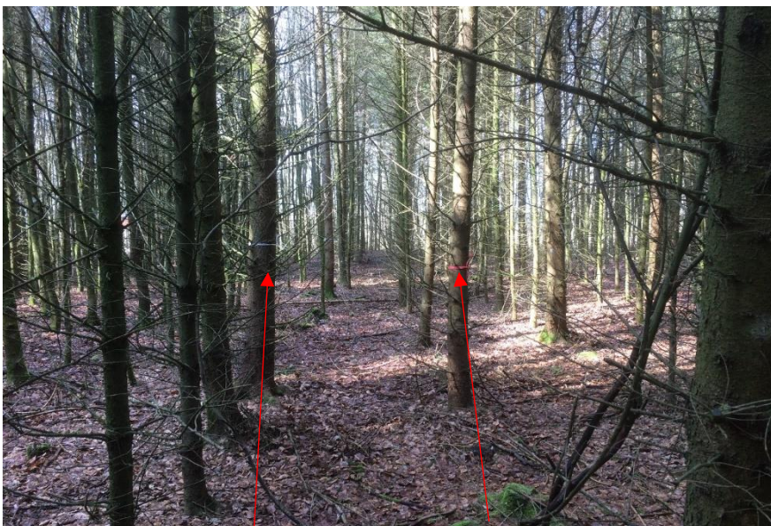
Ausgezeichneter Z-Baum und dessen Bedränger 2018

Deutliche Differenzierung bei Z-Bäumen bereits erkennbar