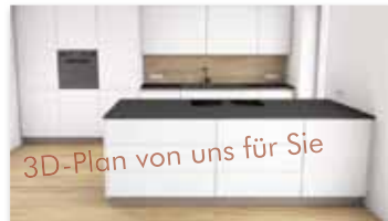
3D-Plan von uns für Sie