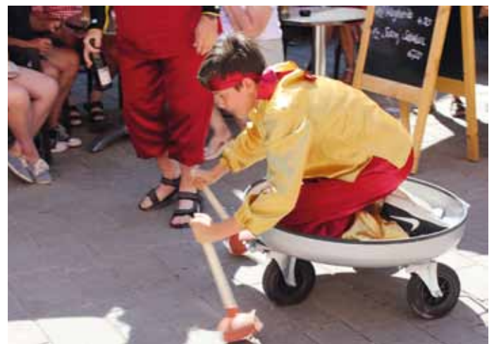
Bildquelle: Stadt Dietfurt a.d.Altmühl

Am zweiten Tag des Bayrisch-Chinesischen Sommers, Sonntag, den 23. Juni, ist für Jung und Alt wieder einiges geboten.